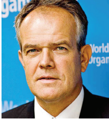
الدكتور إتيان كروغ

تلتزم منظمة الصحة العالمية والمجتمع الدولي المهتم بقضايا السلامة على الطرق بمواجهة الوفيات والإصابات على الطرق التي يمكن الوقاية منها والتي تؤدي بحياة أكثر من ١,٣٥ مليون شخص كل عام وتجرح ملايين آخرين. تعتبر الإصابات المرورية القاتل الأول لشبابنا الذين تتراوح أعمارهم بين ٥ و ٢٩ عامًا. وتترك ملايين العائلات حزينة وفقيرة. يشكل الإفتقار إلى شروط السلامة على طرقنا مشكلة كبيرة للصحة والتنمية.