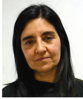
فيفيام بيروني، Madres Del Dolor الأرجنتين