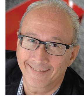
جوب جووس، هولندا

الشراكة الدولية لضحايا الطرق هي عضو في تعاون الأمم المتحدة للسلامة على الطرق، والمجلس الأوروبي لسلامة النقل والمجلس الإستشاري البرلماني لسلامة النقل.